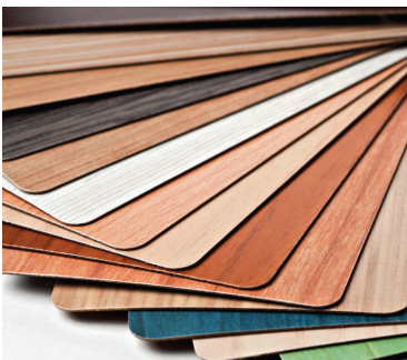
Auswahl an verschiedenen RAL Farben und Laminatverkleidungen