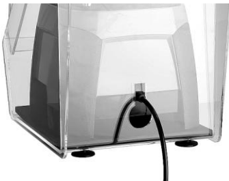
Öffnung für Kabelausgang