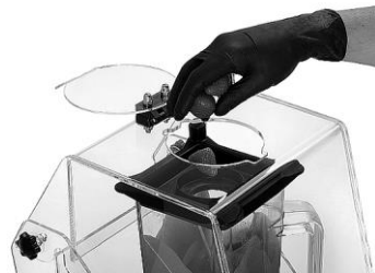
Öffnung oben mit Verschlusskappe