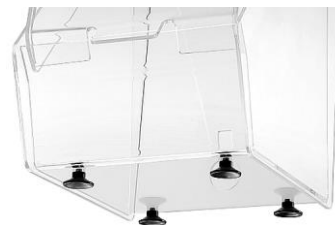
4 Saugnäpfe für sicheren Stand