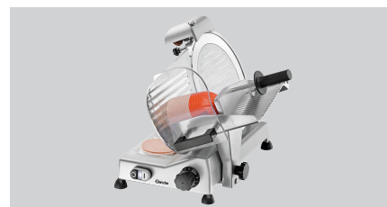
► Ausgelegt für Wurst