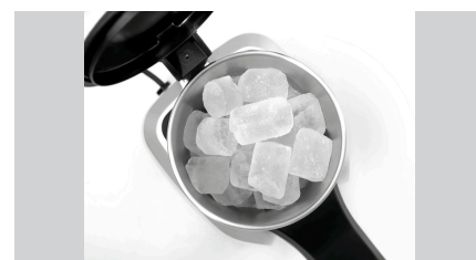
► Inhalt Eisbehälter: ✓ 3 Liter