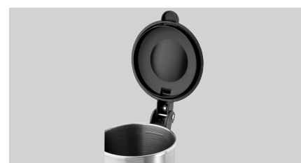
► Mehr Sicherheit ✓ Magnetkontaktschalter am Deckel ✓ 4 rutschfeste Standfüße