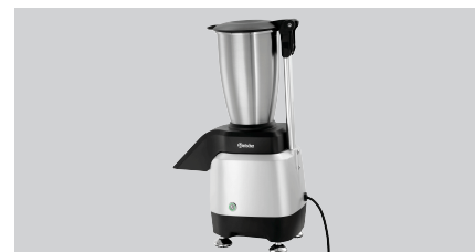
► Leistungsstark ✓ 120 kg / Stunde