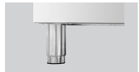
▶ Höhenverstellbare FüÙe