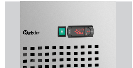
▶ Temperaturbereich von -22 °C bis -18 °C