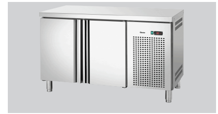
▶ Hochwertige Arbeitsfläche aus Edelstahl