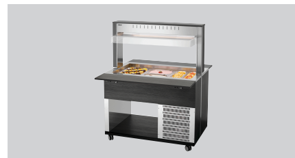
► Buffetwagen für kalte Speisen