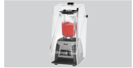
▶ Passend zum Blender PRO 2,5L