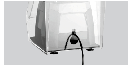
▶ Öffnung für Kabelausgang