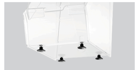
▶ Sicherer Stand ✓ 4 Saugnäpfe