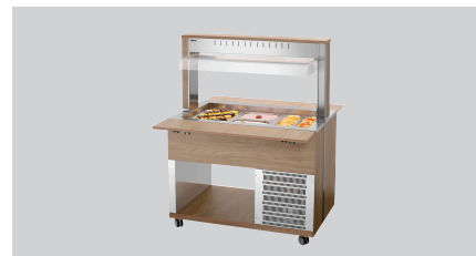
► Buffetwagen für kalte Speisen