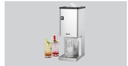
► Eiscrusher mit Auswurftrichter