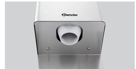
► Direktes Auffangen mit dem Glas möglich