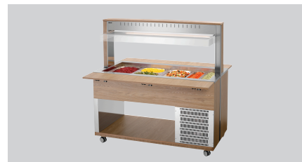
► Buffetwagen für kalte Speisen