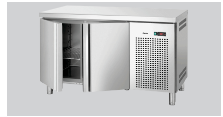
► Ausgelegt für: Tiefkühltsch T2-1341