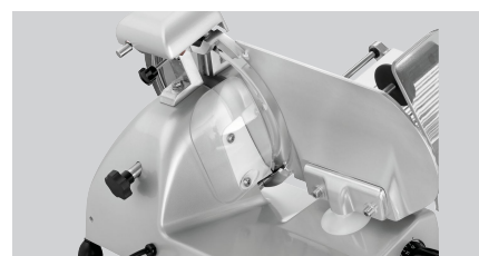
► Saubere Aufschnittführung