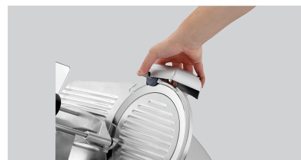
► Praktischer Messerschärfer